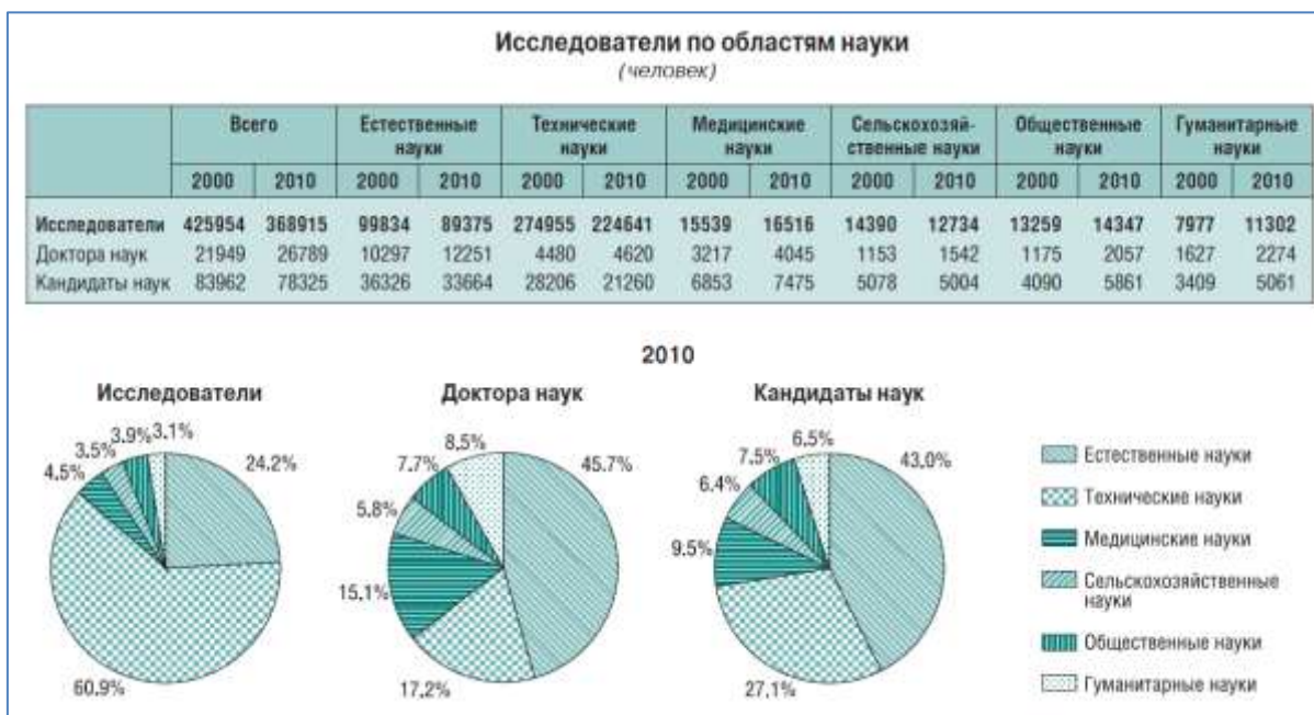
Рис. 3. Распределение исследователей по областям науки (по данным статистического справочника ЦИСН «Наука России в цифрах - 2011»).