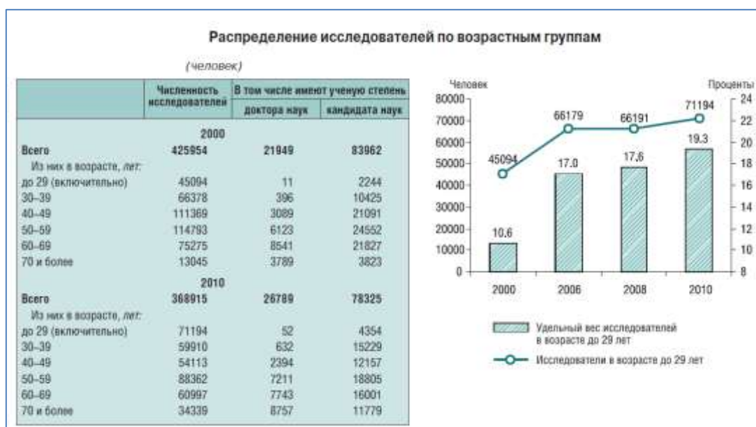
Рис. 1. Распределение исследователей по возрастным группам (по данным статистического справочника ЦИСН «Наука России в цифрах - 2011»).

На рис. 1 приведено распределение исследователей по возрастным группам. Как видно из приведенных на рисунке данных, в наиболее продуктивной группе исследователей в возрасте от 30 до 50 лет наблюдается определенный «провал».